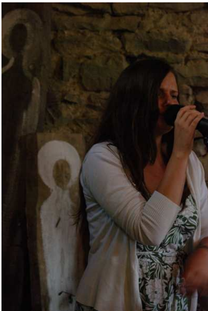
A to Bieszczadzki Chrystus...